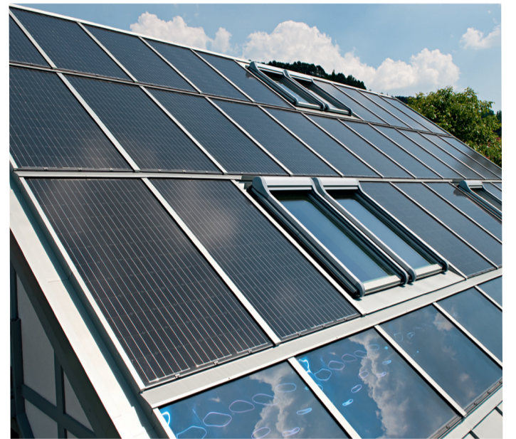
Die Energie unserer Sonne wird durch Solarrezeptoren eingefangen - auch in Wittgenstein sind schon zahlreiche Dächer mit dieser innovativen Technik ausgestattet.

Der Grund dafür: Auch nach den Kürzungen der Einspeisevergütung bleibt die Investition in eine Solaranlage nicht nur ökologisch sinnvoll, sondern auch ökonomisch vernünftig. Das gilt vor allem für Anlagen, die für die Eigennutzung des selbst produzierten Solarstroms ausgelegt sind: für Photovoltaikanlagen mit einer Leistung bis zu 30 Kilowatt, die seit dem 1. Januar 2011 in Betrieb gegangen sind oder in Betrieb genommen werden, kann der Eigentümer vom Netzbetreiber bei Eigenverbrauch bis zu 30 Prozent 12,36 Cent pro Kilowattstunde einstreichen. Bei mehr als 30 Prozent selbst verbrauchten Stroms sogar 16,74 Cent pro Kilowattstunde. Daneben schlägt natürlich bei Selbstnutzung die Stromkostenersparnis zu Buche. Je nach Stromtarif macht dies ein Plus von über 8 Cent pro Kilowattstunde gegenüber der herkömmlichen Einspeisung aus.